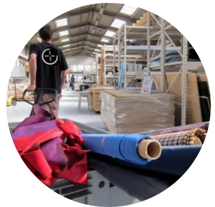
La réserve de matériaux